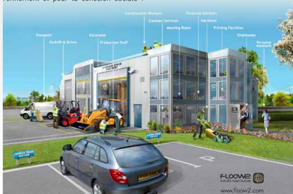
Floow2 permet aux entreprises et aux collectivités de partager des équipements, des services voire du personnel.