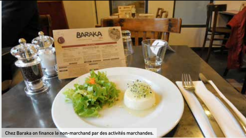
Chez Baraka on finance le non-marchand par des activités marchandes.