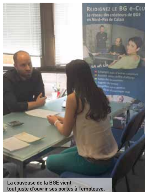
La couveuse de la BGE vient tout juste d'ouvrir ses portes à Templeuve.